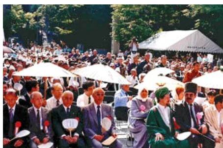
Япония, Хиросима. Симпозиум «День памяти жертв ядерного взрыва». 1981г.

حسبنا الله ونعم الوكيل! نعم المولى ونعم النصير!!!