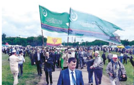
Шествие к Большому минарету. 2012г.