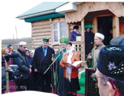
Церемония открытия мечети.