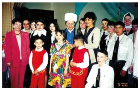
С выпускниками Детского дома №1 г.Уфы, 2000г.